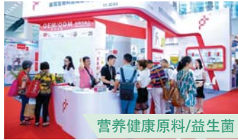
营养健康原料/益生菌