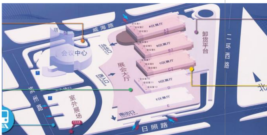
山东国际会展中心